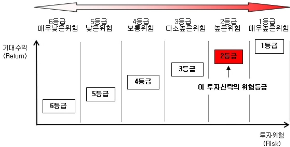
[집합투자기구 위험등급 분류기준 및 상세설명]